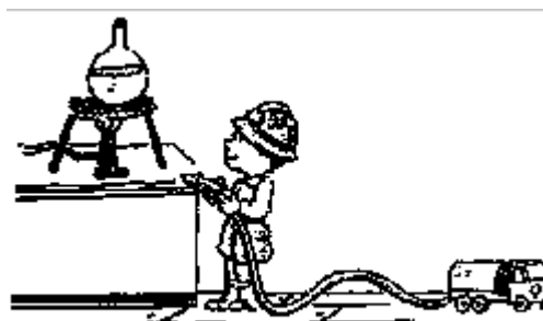
Wees voorzichtig !!!!