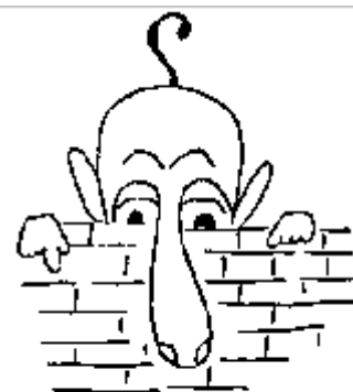
Wat is dat? Waarnemen?