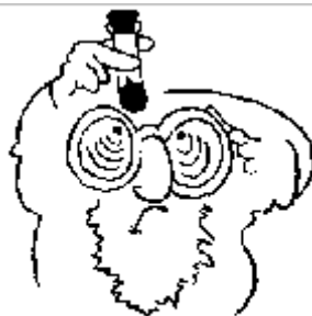
Waarnemen, met kurk op het buisje.

verschillende reageerbuisjes met een stof.