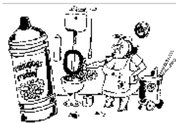
Reinigingsmiddel voor de wc.

In de keuken gebeuren soms ook rare dingen. We bewaren daar allerlei stoffen zoals, chloor, zout, spiritus, afwasmiddel, wasbenzine e.d. Kleine kinderen kijken wel eens in de kastjes. Ze zien daar flessen staan met een gekleurde vloeistof.